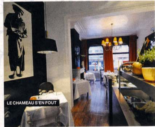
LE CHAMEAU S'EN FOUT