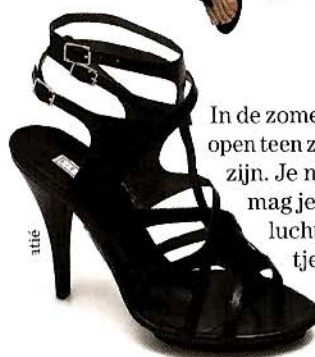
In de zomer mag het wat luchtiger. Een laars met open teen zal daarom binnenkort geen uitzondering zijn. Je nagels lakken in een blinkend kleurtje mag je dan ook zeker niet vergeten. Nog wat luchtiger zijn de sandaaltjes, die meer dan ooit tevoren aan elkaar geregen zijn met lintjes.