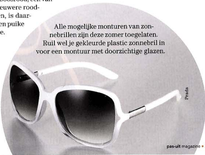
Alle mogelijke monturen van zonnebrillen zijn deze zomer toegelaten. Ruil wel je gekleurde plastic zonnebril in voor een montuur met doorzichtige glazen.