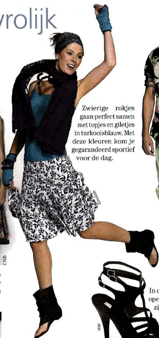
Zwierige rokjes gaan perfect samen met topjes en giletjes in turkooisblauw. Met deze kleuren kom je gegarandeerd sportief voor de dag.