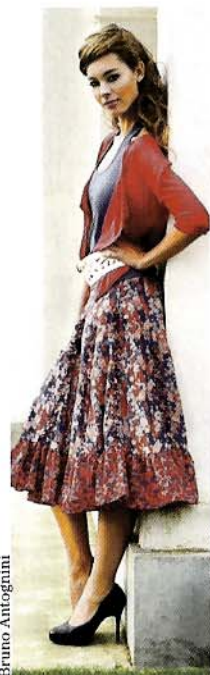
Bloemen en nog eens bloemen. Na een grauwe winter willen we het vrolijk. Je ziet ze in de natuur in alle kleuren en geuren, maar evenveel op je jurk.