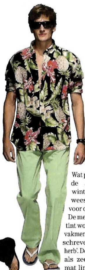
Wat paars voor de afgelopen winter(s) is geweest, is groen voor dit voorjaar. De meest geziene tint wordt door de vakmensen wel omschreven als 'dried herb'. Denk aan tinten als zeewiergroen, mat lindegroen en kaki.